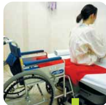
介護用具「 移座えもん 」

さらに「 移座えもん 」という介護用具を使用しての簡単移動方法の推進も繰り返し行っています。昨年度は院外からの看護職・介護職の参加希望もあり研修会を開催しました。看護される人と看護