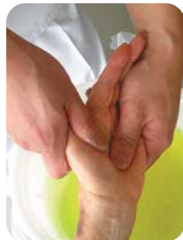
…手浴後の軽いマッサージ

私達看護職員が看護として学習してきたことは、介護する人にも共通する所が多くあると思います。そこで、今後は多くの皆さんに「楽ラク介護技術」を紹介していきたいと考えています。地域の皆さんと一緒に体験しながら、お話ししながら研修会をすすめていきたいと考えています。