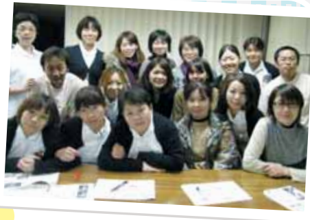
▲5階北病棟スタッフ