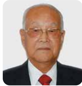
岐阜県厚生農業協同組合連合会 経営管理委員会会長