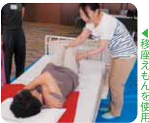
移座えもんを使用